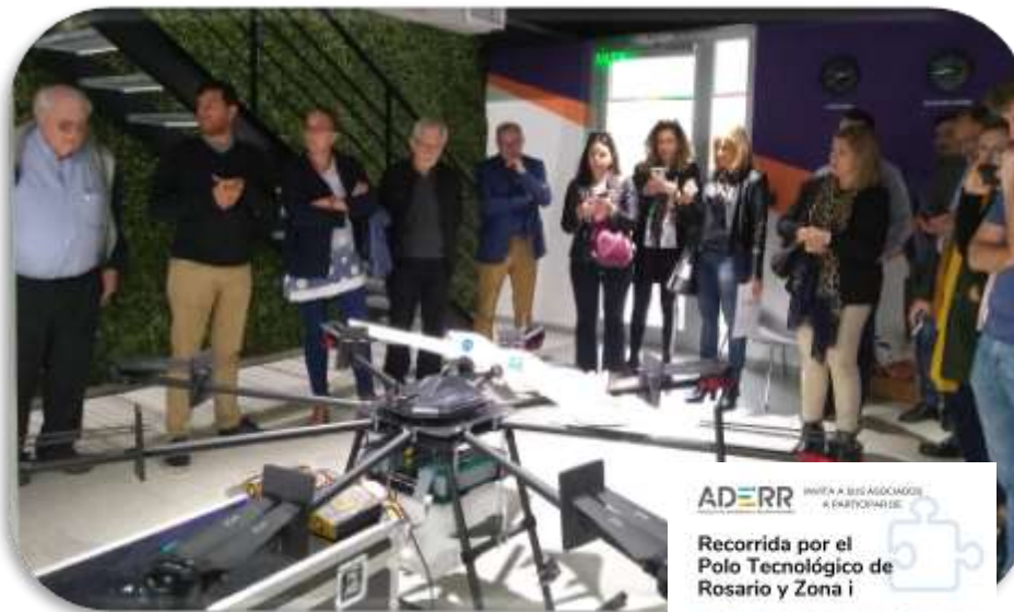
Polo Tecnológico y Zona I

Coordinamos recorridas invitando a integrantes de la comunidad ADERR